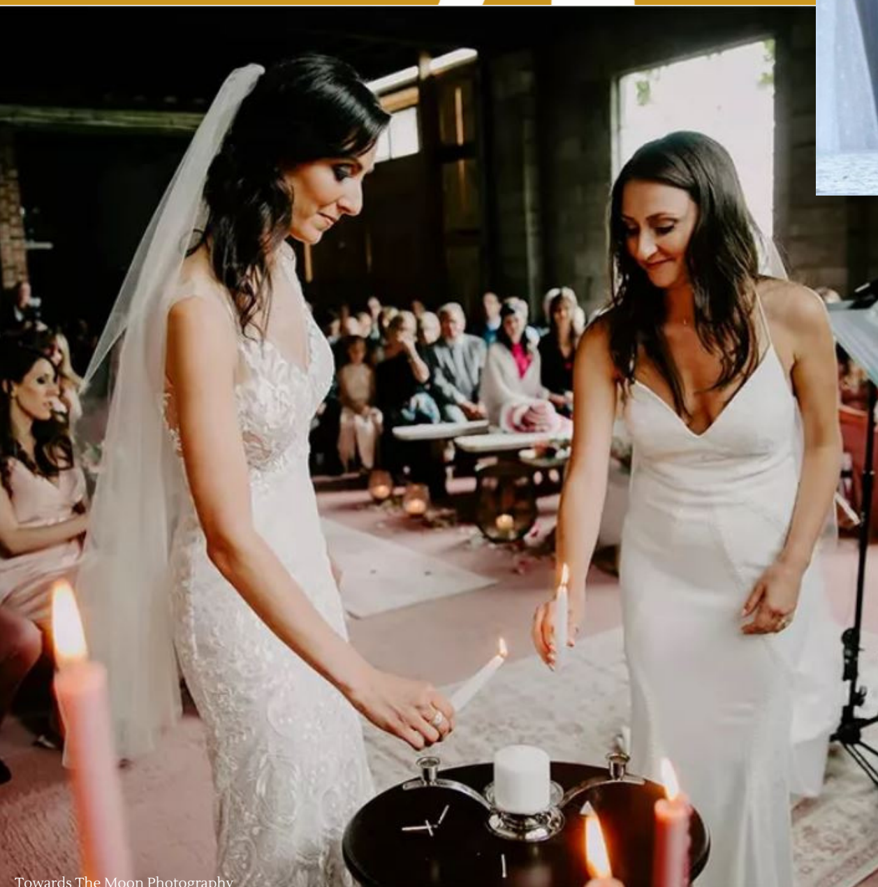
Towards The Moon Photography